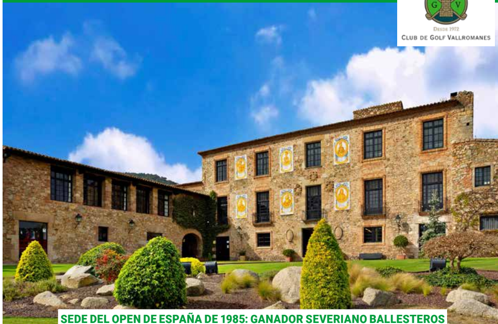
SEDE DEL OPEN DE ESPAÑA DE 1985: GANADOR SEVERIANO BALLESTEROS