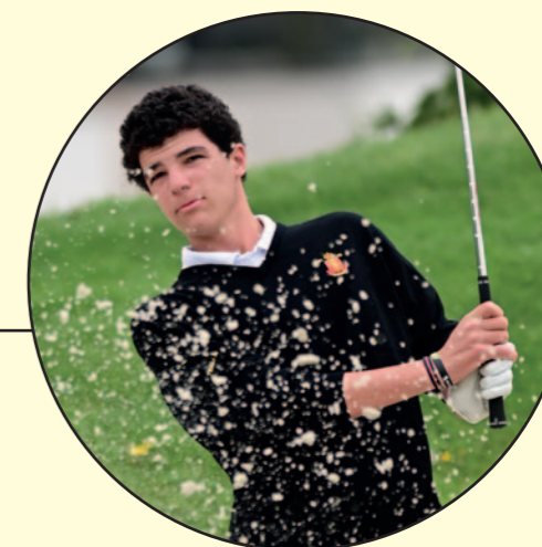
Oliver de Wint en 13 preguntas