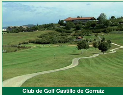
Club de Golf Castillo de Gorraiz

Los 2 días tendremos aproximaciones en los pares 3 con un carro eléctrico incluido Hole in One (hoyo a designar)