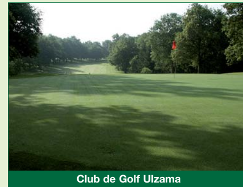
Club de Golf Ulzama

PREMIOS TORNEO CATALUNYA CUP - ALISGOLF 1º: Trofeo Alisgolf + Fin de Semana Hotel Nacional (2p.) 2º: Trofeo Alisgolf + Fin de Semana Hotel en Catalunya (2p.) 2ª JORNADA TORNEO TRAVEL & EVENTS 1º: Trofeo + Fin de Semana Apartamento 4 personas + 2 green fees en Club de Golf Bonmont 2º: Trofeo + Fin de Semana en Aparthotel Golf Beach en Pals (Girona)