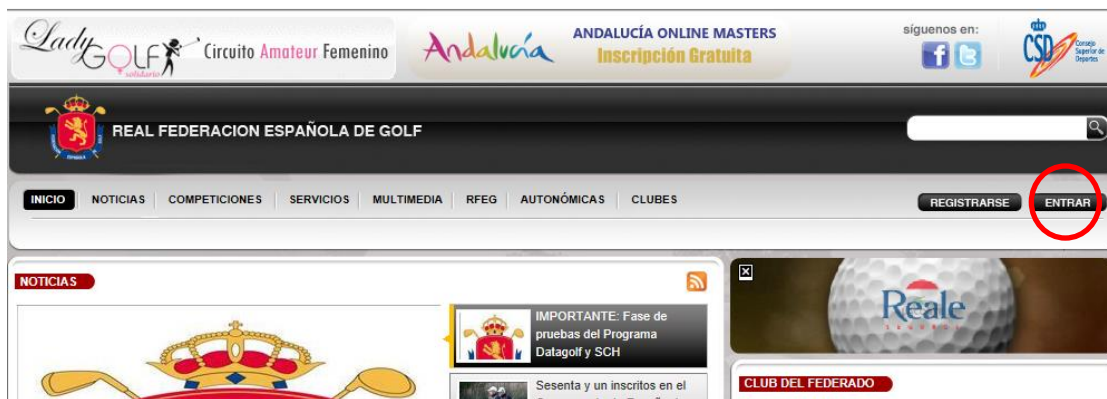
Imagen 1 Página principal www.rfegolf.es

Una vez accedemos a la página de la RFEG ( www.rfegolf.es ) debemos identificarnos como usuarios de un Club, Federación Autónoma o Comité de la RFEG haciendo clic en el botón 'ENTRAR' (ver globo rojo en Imagen 1).