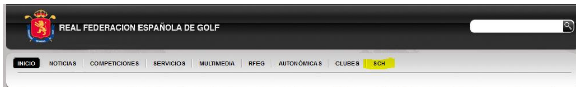
Imagen 2 Nueva opción 'SERVIDOR CENTRAL HDCPS'

Para identificarnos debemos utilizar los usuarios y contraseñas del MICROSITE de cada uno (la contraseña que se utiliza para la introducción del Calendario de Pruebas en la web). Una vez identificados nos aparecerá una nueva opción en la tira de opciones (ver globo rojo en Imagen 2):